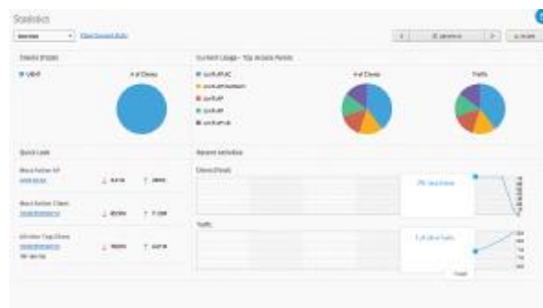
Obrázok: UniFi Dashboard